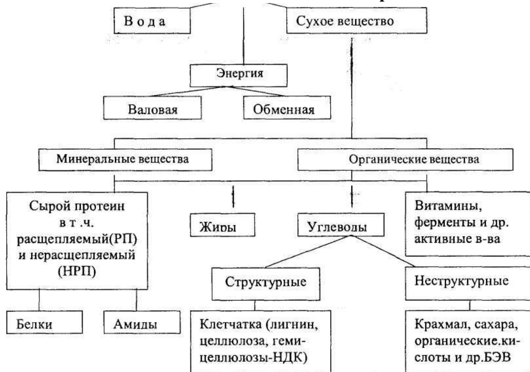
Рис.2. Новая схема анализа кормов

Данная схема зоотехнического анализа используется без изменений на протяжении более пятидесяти лет. Вместе с тем, в связи с переходом к детализированным нормам кормления и применением новых методов оценки питательности кормов, в схеме должна быть предусмотрена более детальная расшифровка состава и питательности кормов в соответствии с контролируруемыми показателями питания животных. Прежде всего, это относится к оценке энергетической, протеиновой и углеводной питательности кормов.